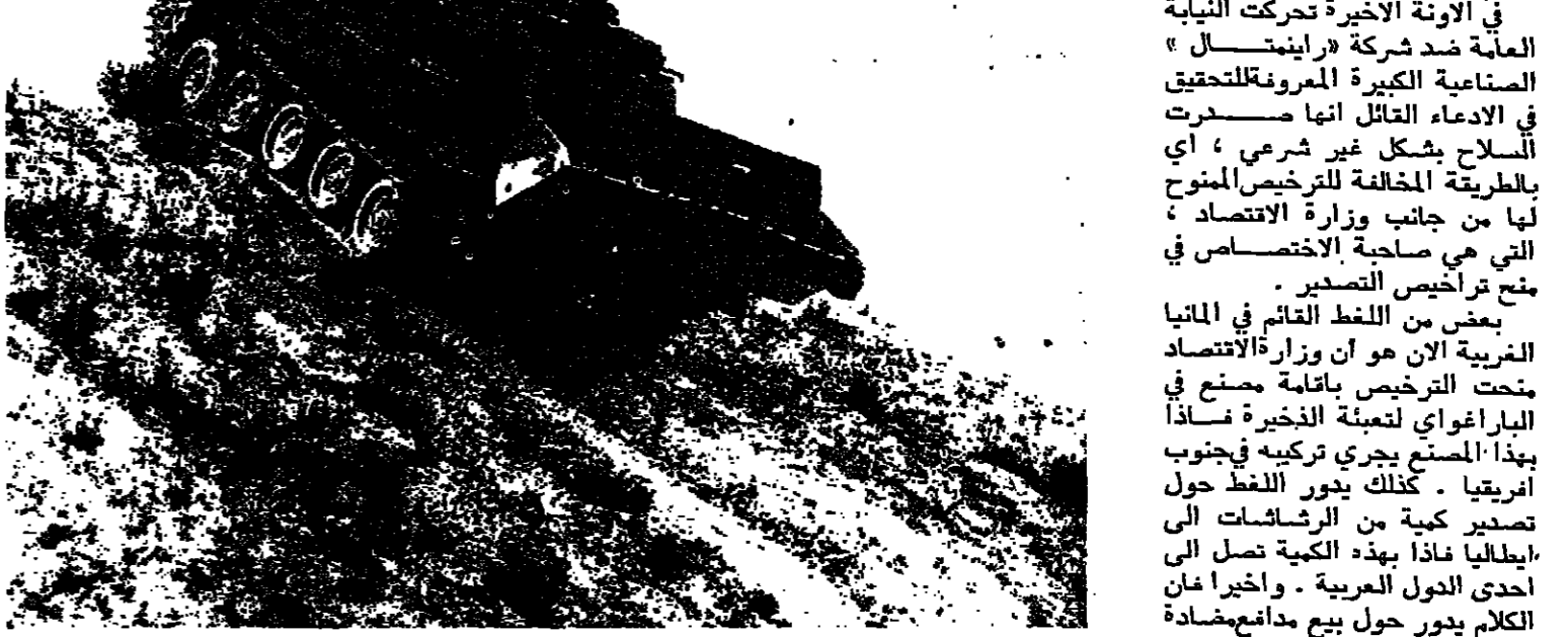
مجنزرة المانية متطورة

في الآونة الأخيرة تحركت النية العامة ضد شركة «راينستال» الصناعية الكبيرة المعروفة لتحقيق في الادعاء القائل انها مصدرت السلاح بشكل غير شرعي، اي بالطريقة المخالفة للترخيص الممنوح لها من جانب وزارة الاقتصاد، التي هي صاحبة الاختصاص في منح تراخيص التصدير. بعض من اللفظ القائم في ألمانيا الغربية الان هو ان وزارة الاقتصاد منحت الترخيص باقامة مصنع في الباراغواي لتعلمة الذخيرة فإذاً بهذا المنتج يجري تركيبه في جنوب افريقيا. كذلك يدور اللفظ حول تصدير كمية من الرشاشات الى إيطاليا فإذاً بهذه الكمية تصل الى إحدى الدول العربية. واخيراً كان الكلام يدور حول بيع مدافع مضادة للطائرات الى اسبانيا فإذاً بهذه